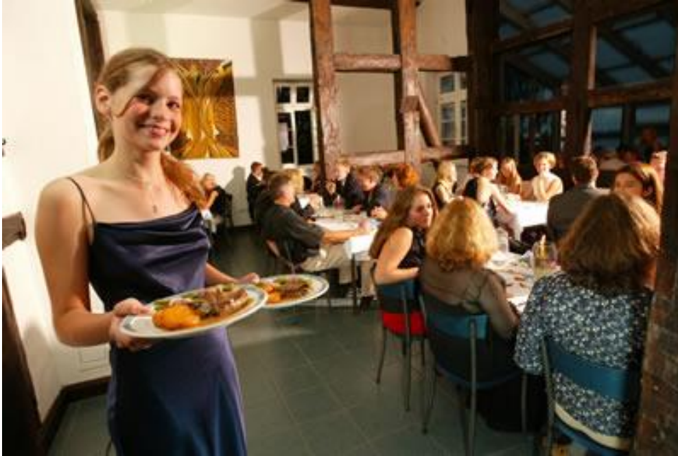
Veranstaltung auf Schloss Torgelow 34

Weitere Veranstaltungen außerhalb der Schule sind Wandertage , Studienfahrten , Exkursionen und Schüleraustausche . Diese finden immer mehr Zuspruch bei den Schülern.