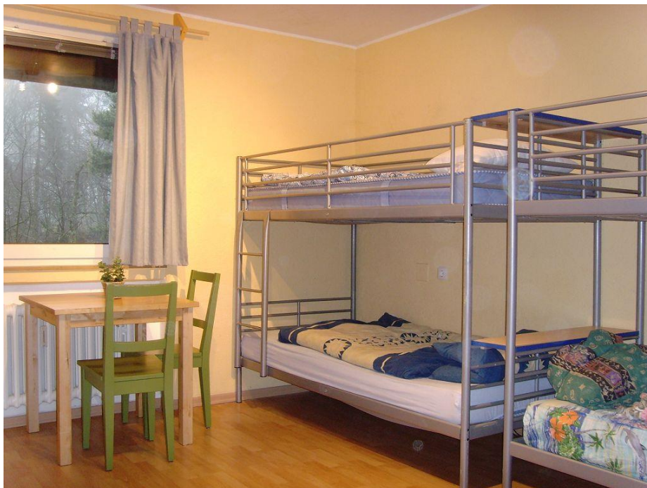
Beispiel für ein Internatszimmer 26

Allgemein ratsam ist allerdings, wertvolle Gegenstände lieber zu Hause zu lassen, da der Großteil an Internaten keine Haftung für Verschwundenes übernimmt. 25