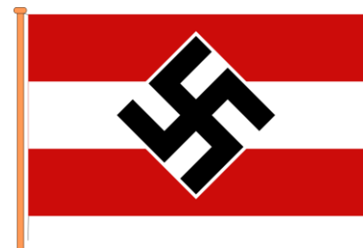
19 Flagge der Hitlerjugend

So kam es auch, dass Kinder ab 1939 in eine solche Organisation eintreten mussten. Es wurde allerdings geschlechtlich getrennt. Während die Jungen ab dem 10. Lebensjahr ins „Jungvolk“ aufgenommen wurden, wo sie mit höherem Alter höhere Dienstgrade erreichen konnten, diente die Ausbildung der Mädchen lediglich dazu, um sie auf die spätere Mutterrolle vorzubereiten.