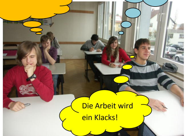
... setzt sich auf seinen Platz. Die Lehrerin ist noch nicht da.