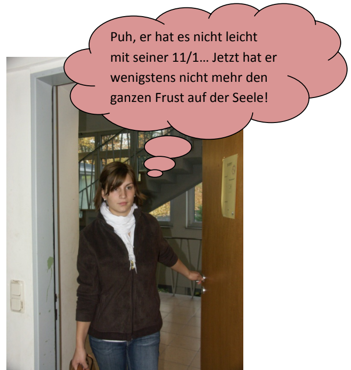
Die Lehrerin kommt ohne Entschuldigung 15 Minuten zu spät.