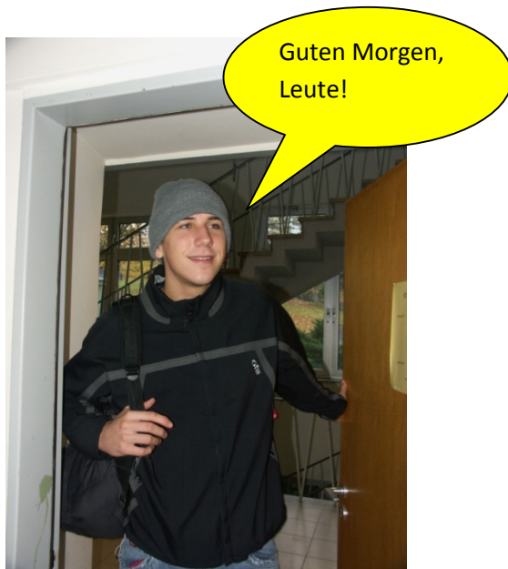
... betritt er fröhlich das Klassenzimmer und ...