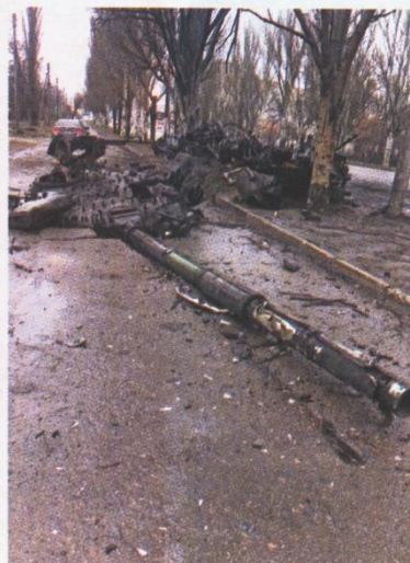
Explodierter Panzer unter meinem Haus am 25. Februar