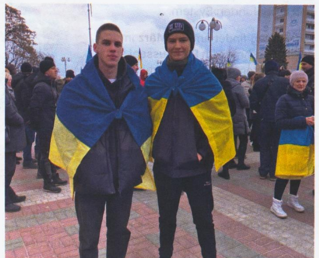
Mein Freund und ich (links) bei einer pro-ukrainischen Kundgebung in der besetzten Stadt am 5. März