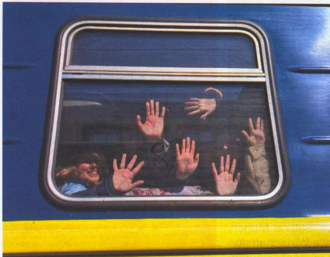
Evakuierungszug, dann habe ich meine Eltern zuletzt am 28. März gesehen