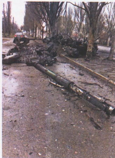
Explodierender Panzer unter meinem Haus am 25. Februar