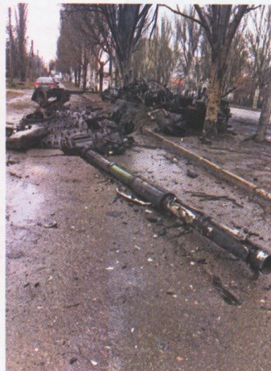
Explodierter Panzer unter meinem Haus am 25. Februar