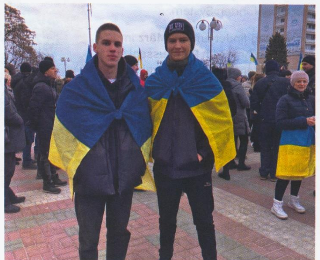
Mein Freund und ich (links) bei einer pro-ukrainischen Kundgebung in der besetzten Stadt am 5. März