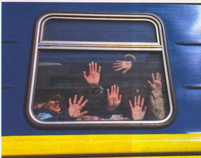
Evakuierungszug, dann habe ich meine Eltern zuletzt am 28. März gesehen

Wie ein einziger Tag im Leben alles verändern kann