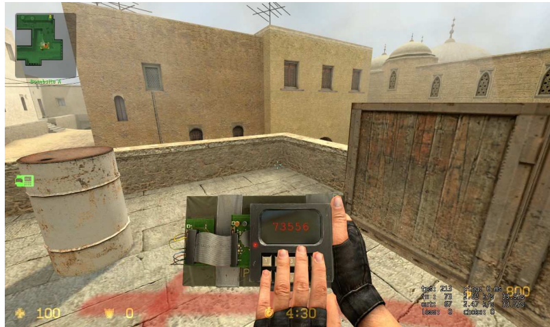
Bombe legen in „Counter-Strike“

Beispiel wird „Counter-Strike“ unterstellt, dass es Spielern beibringen würde, wie man eine Bombe legt. Das ist aber totaler Quatsch, wenn man die Bombe in „Counter-Strike“ legt, sieht man nur ein kleines Display mit Zahlen und eine Hand, die darauf herumtippt.