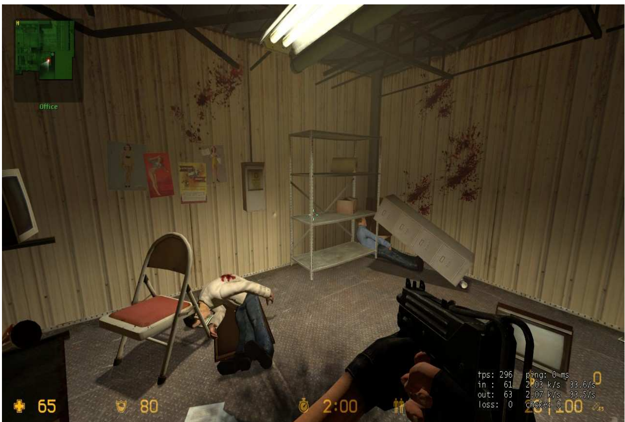
2 tote Geiseln im Spiel „Counter-Strike:Source“.

„Counter-Strike“ hat seinen schlechten Ruf erst ab der Version bzw. Modifikation Source bekommen. Das Hauptspiel gibt es schon seit 1999, jedoch kam dann 2004 „Counter-Strike:Source“ mit verbesserter Grafik (Darstellung).