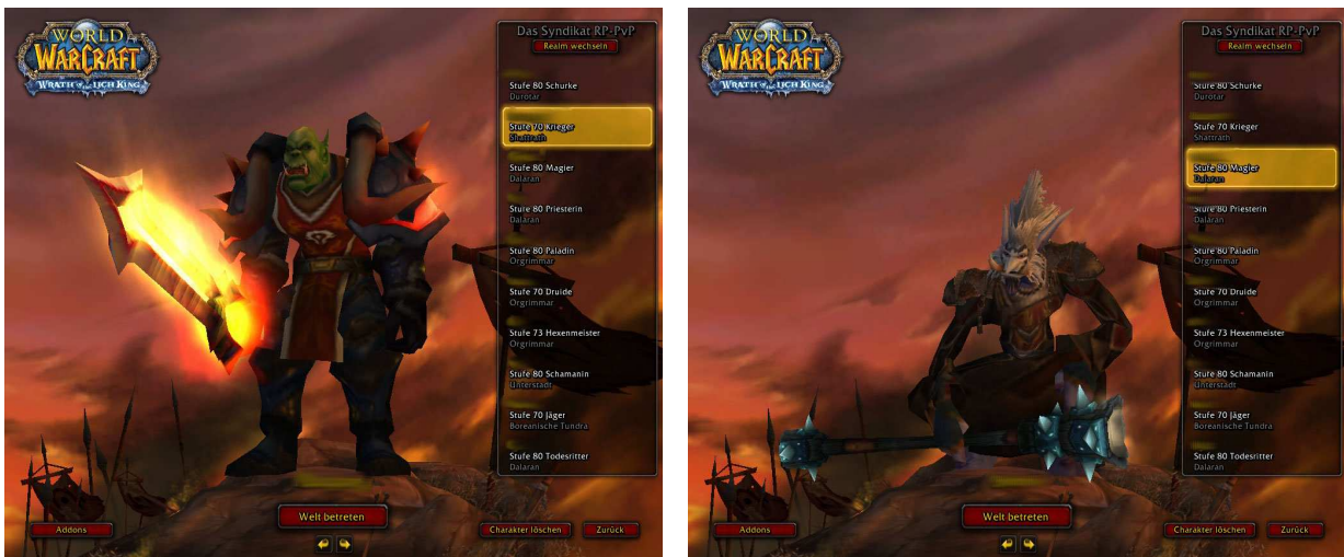
Beispiele eines Kriegers und Magiers aus dem Spiel „World of Warcraft“

Im Grunde genommen gibt es 5 Hauptklassen, die Krieger, Jäger, Heiler, Magier und Schurken. Jede Klasse hat Fähigkeiten, die sie mit anderen teilt und Fähigkeiten, die nur diese bestimmte Klasse besitzt. Somit hat z.B. der Magier die Fähigkeit zu zaubern und Kreaturen zu beschwören, welche der Krieger nicht hat. Er kann im Gegensatz zum Magier z.B. nicht nur Stoffklamotten als Rüstung tragen, sondern kann schwere Rüstung tragen, die ihn besser vor Angriffen schützt.